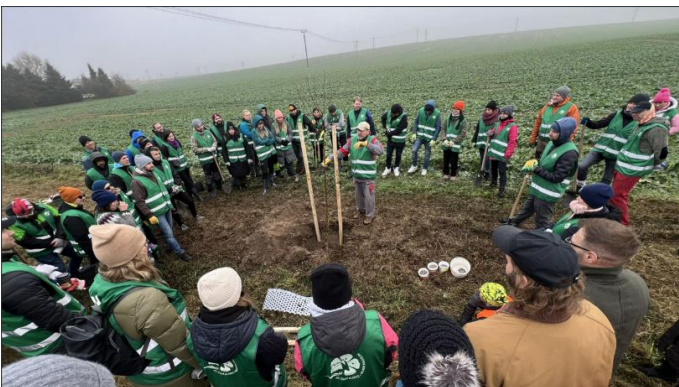
Podél silnice z Bosně do Kněžmosta