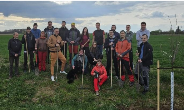
Podél cesty u obce Čistá