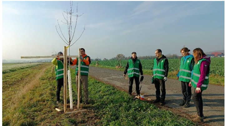
Dosazování podél silnice Boseň – Lhotice