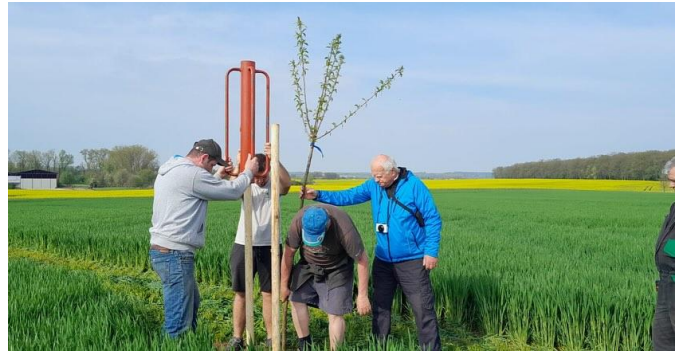
Dokončení polní cesty u obce Buda