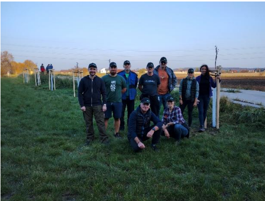
Cyklostezka Řepov – Kolomuty