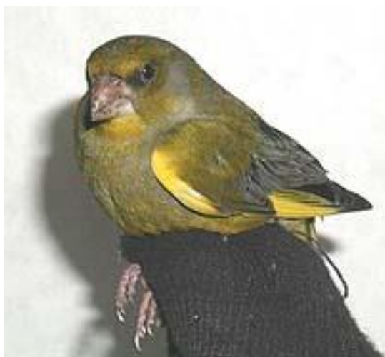
Zvonek zelený - sameček

Jistě pro svůj zvonivý a příjemný zpěv dostal tento zelenavý ptáček své jméno zvonek. Zdržuje se u nás po celý rok, živí se rostlinnou potravou ( semena, pupeny, výhonky, bobule ). Hnízdí v zahradách, v parcích i ve stromořadích. Samička je šedá se zelenavým nádechem a sameček má žlutozelenou hrud. Mladí ptáci jsou zbarvení více do hnědé a jsou podélně pruhovaní.