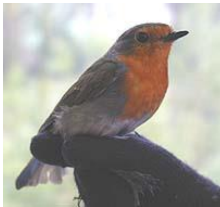
Červenka obecná - sameček

Je veliká jako vrabec, stejně čilá a neposedná. Zobáček má jako šidélko, oranžově červená prsa, líce a čelo, horní strana těla je nenápadně našedle olivová.