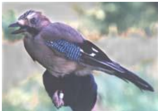
Sojka obecná – sameček

Rozeznáme ji podle modro – černo - bílých peříček v křídelním „zrcadélku“. Živí se sice hmyzem, červy, měkkýši, žábami a myšmi, ale ničí i hnízda, rozklouvává vajíčka a hubí ptáčata. Nejen drobné ptactvo, ale i koroptve a bažanty.