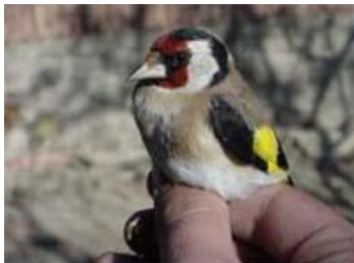
Stehlík obecný – sameček

Je to pestrý, veselý a povídativý ptáček. Barvami na něm příroda nešetřila. Sameček i samička jsou pěkně strakatí, jen mláďata jsou střízlivější, hnědá, bez černé a červené. Stehlíka známe všichni alespoň z obrázků, kde bývá obvykle namalován na bodlácích, jak vybírá semínka. Stejně rád však sbírá i semena divizny, břízy a olší. Mívá hnízdo vysoko v korunách listnáčů a v květnu v něm najdeme čtyři až pět zelenavě bílých skvrnatých vajíček. Hnízdí i dvakrát do roka.