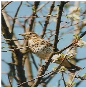
Drozd zpěvný – samec

Je to velký kropenatý pták. Můžeme ho najít v lesích, od nížin až vysoko do hor, též ve vinicích, ovocných sadech, zahradách a parcích měst i vesnic. Zdržuje se často na zemi, po níž se velmi rychle pohybuje, zpívá však vysoko na stromech.