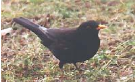
Kos černý - samec

S kosem se setkáte v každém parku. Původně to byl plachý lesní pták, ale postupně se přizpůsobil životu po boku člověka. Je to sice pěvec hmyzožravý a zjara opravdu sbírá hmyz, plže a mnoho dešťovek, ale když začne zrát peckové ovoce, bobuloviny a víno, sběr ovoce převáží nad sběrem hmyzu.