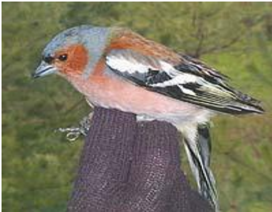
Pěnkava obecná – sameček

Patří mezi hojně semenožravé ptáky. Někdy si jídelníček zpestřuje zelenými lístky a hmyzem.