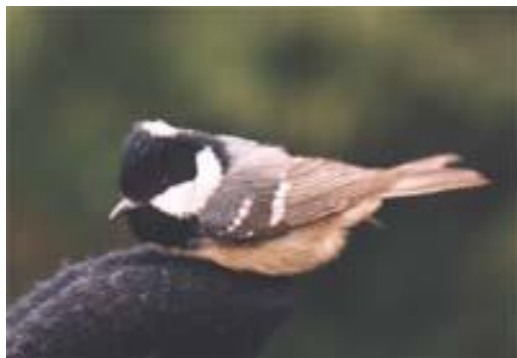
Sýkora uhelníček - sameček

Tato sýkorka, která je mnohem menší než vrabec, žije převážně v jehličnatých lesech. Je trochu podobná koňadře, ale vespod je šedobílá. V týlu má bílou skvrnu. Zatoulá se ovšem ráda i do smíšených lesů a v zimě i do městských parků, takže i tam můžeme zaslechnout její příznačné „vice-vice vida-vida“.