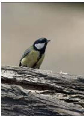
Sýkora koňadra – sameček

Je to naše největší sýkorka. Velká je jako vrabec. Má černý pruh po délce žlutého břicha. Hnízdí na zahradách, v parcích, v dutinách starých stromů, ale i v poštovních schránkách.