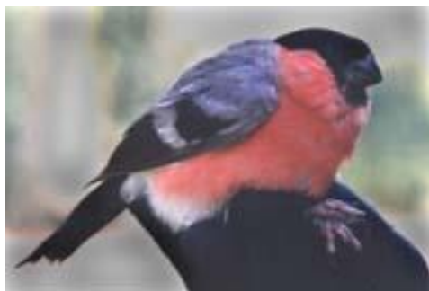
Hýl obecný - sameček

Postavou stejný, zbarvením různý – takový jsou samička a sameček hýla obecného. Sameček má vestu červenou, samička je nenápadnější, narůžověle šedá. Mláďatům dokonce chybí i černá čepička. Patří k našim nejhezčím ptákům. Překvapíme ho nejspíš někde v lese na horách, ale ani v našich nížinách není nijak vzácný. Pták je to důvěřivý. Hýl se živí vyštíčováním pupenů, semen a zrněk, požírá bobule a také trochu hmyzu.