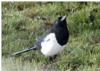
Straka obecná – sameček

Pták velký asi jako holub. Má třpytivě černé a bílé peří a typický dlouhý stupňovitý ocas. Hnízdí v otevřené kulturní krajině s křovinami a stromy. Je stálá. Straka hledá hmyz na zemi, nebo v křovinách, loví polní myši, ptáky a vybírá ptačí hnízda, sbírá i zvířata přejetá na silnici.