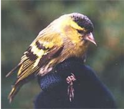
Čížek lesní – sameček

V době hnízdění žije v jehličnatých horských a podhorských lesích. Od září se začne houfovat a lze ho spatřit i v nížinách na olších a břízách. Při získávání semen z těchto stromů je často zavěšen i na nejtenčích větvičkách hřbetem dolů.