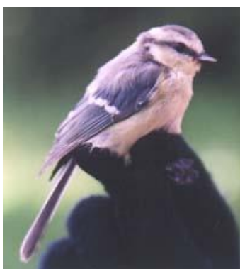
Sýkora modřinka – mládě

Sýkora modřinka připomíná sýkoru koňadru, ale na rozdíl od koňadry je svrchu celá modrá a proužek na žlutém bříšku je neznatelný. V zahradách, v parcích i v lesích po celý rok hledá neúnavně nějaké hmyzí vajíčko, housenku, kukličku i hmyz samotný.