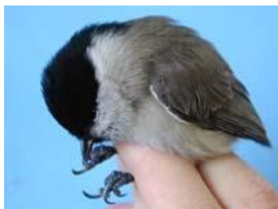
Sýkora babka - sameček

Sýkora babka žije převážně v ovocných sadech, v listnatých porostech, v polních hájích apod. Je menší než vrabec, svrchu šedohnědá, vespod bělavá, na hlavě nosí leskle černou čepičku a černou má i bradku.