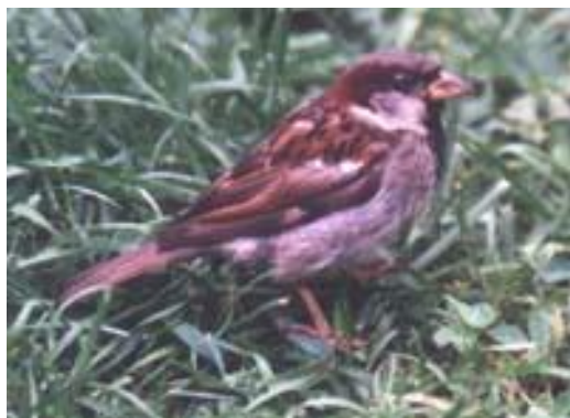
Vrabc domácí - sameček

Sameček má temeno a záhlaví popelavé a kaštanově hnědými pruhy obroubené, hrdlo černé. Vrabčice tuto černou náprsenku nemá, je vůbec barevně mdlejší, šedohnědá.