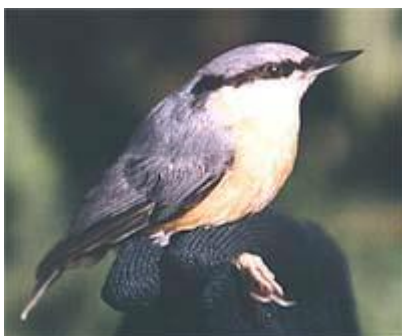
Brhlík lesní - sameček

Setkáme se s ním ve starých parcích s rozložitými listnáči. Je velký jako vrabec. Zbarvení má modrošedé, zespodu světle žlutohnědé, má černou pásku přes oko. Jako jediný z našich ptáků dokáže šplhat po kmeni stromu i hlavou dolů.