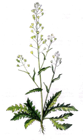
kokoška pastuší tobolka