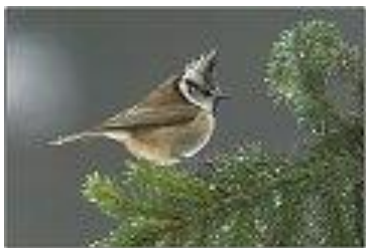
Sýkora parukářka - sameček

Ptáček je to menší než vrabec, celkem šedohnědý, tvářičky a límeček má bílé. Rozpoznávacím znakem je chocholka – paruka.