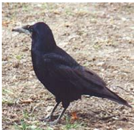
Havran polní – sameček

Všeobecně známý, velký, černý, kovově lesklý pták se silným zobákem. Dospělí mají kůži u kořene zobáku lysou.