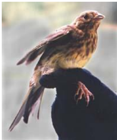
Strnad obecný – dospělý pták

Žije v otevřené krajině se skupinami keřů a stromů. Je velký jako vrabec. Má tmavší rezavě hnědý ocas, černavě pruhovaný hřbet a bílá krajní ocasní péra. Sameček má jasně žlutou hlavu. Samička je značně bledší.