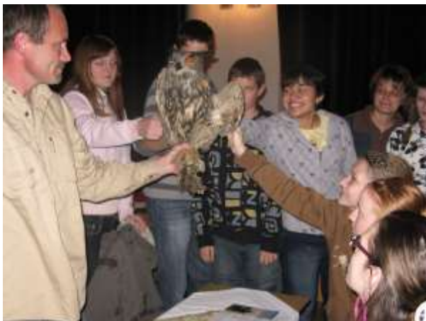
Přednáška o handicapovaných zvířatech