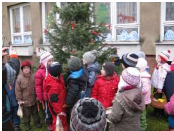
Zdobení vánočního stroměčku