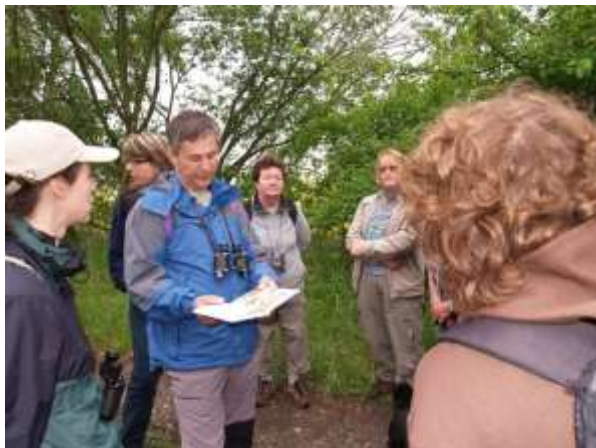
Vítání ptačího zpěvu

V roce 2008 jsme pořádali celkem 51 ekologicko - výchovných akcí , kterých se zúčastnila 1 236 osoba . Pořádáme exkurze, přednášky, výrobní dílny, semináře a soutěže pro děti a mládež. Již pátým rokem jsme uspořádali s dětmi MŠ Štěpánka akci s názvem „Zdobení vánočního stroměčku“, třetím rokem veřejností hojně navštěvovanou akci „Vítání ptačího zpěvu“.