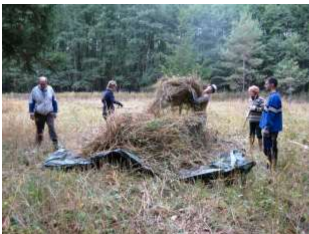
Sekání louky v NPP Klokočka