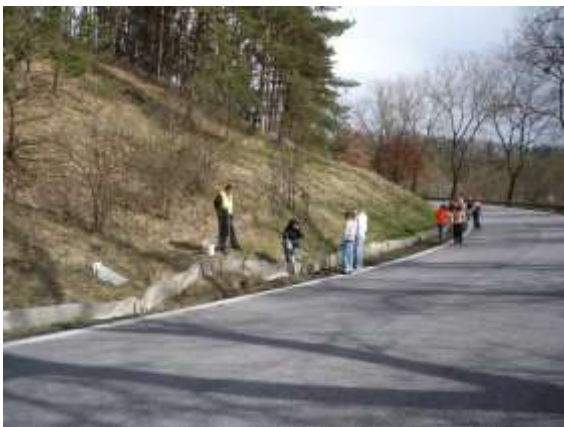
Stavba bariér u Dolní Krupé