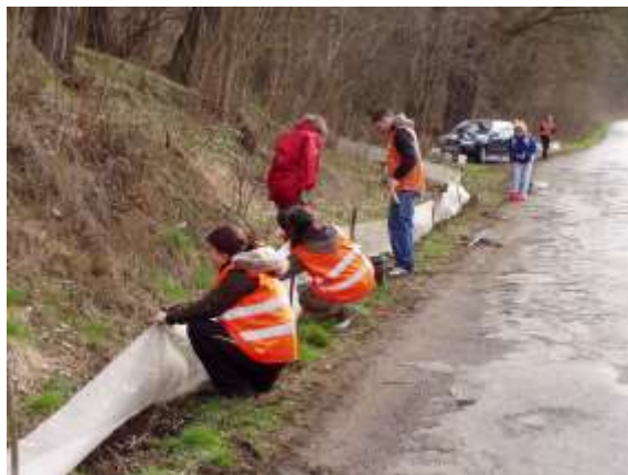
Stavba bariér u Dolního Cetna

Přenesli jsme 1 487 ropuch obecných, 12 skokanů hnědých, 4 skokany štíhlé (silně ohrožený druh), 1 skokana ostronosého (kriticky ohrožený druh), 10 čolků obecných (silně ohrožený druh) a 1 blatnici skvrnitou (kriticky ohrožený druh).