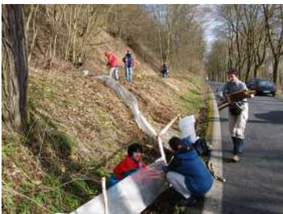
Stavba bariér v PP Podhradská tůň

Na stavbě bariér a přenášení obojživelníků se podílelo 13 členů ZO ČSOP Klenice, 10 dobrovolníků a 35 žáků a studentů mladoboleslavských škol. Při stavbě bariér nám významně pomohli studenti Střední integrované školy v Mladé Boleslavi, kteří postavili bariéry u rybníka Krupský v délce 800 m.