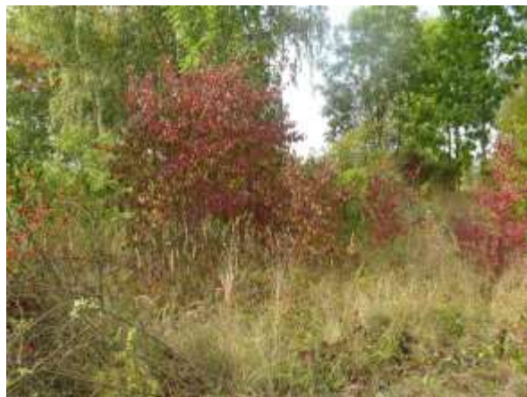
Lokalita před zásahem

V NPP Radouč jsme na konci roku 2008 začali v jedné z nejhroženějších lokalit odstraňovat téměř 70 % zeleného porostu a vracet lokalitě stepní charakter. V lokalitě převládala především růže šípková, svída krvavá, trnovník akát, ostružiník, třtina křovištní, hloh atd. Území postupně degradovalo a sloužilo jako útočiště mnohým bezdomovcům a k ukládání komunálního odpadu.