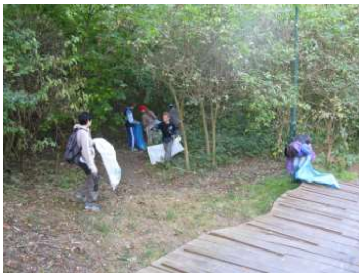
Úklid NPP Radouč