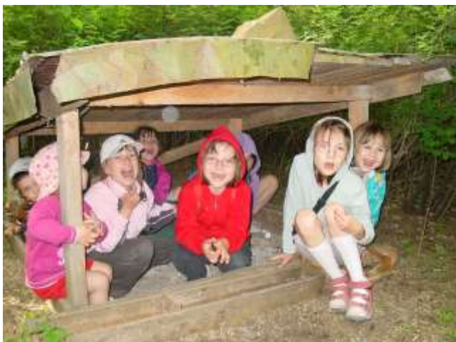
Výprava na Chlum