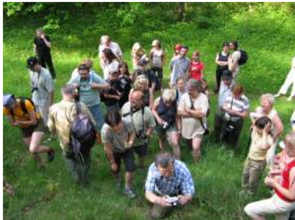
Exkurze do Bělska