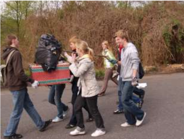
Studenti Střední ekonomické školy při sběru odpadků