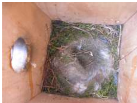
Prázdné hnízdo po úspěšně vyvedených mláďatech sýkory modřínky