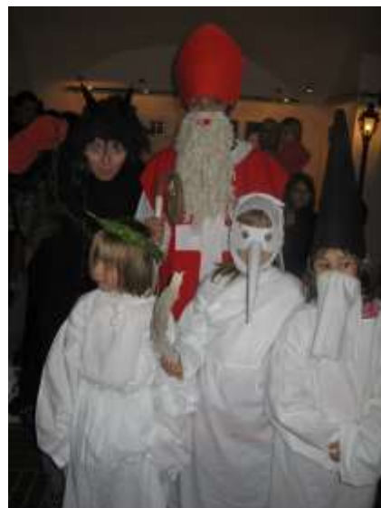
Advent v Muzeu Mladoboleslavka