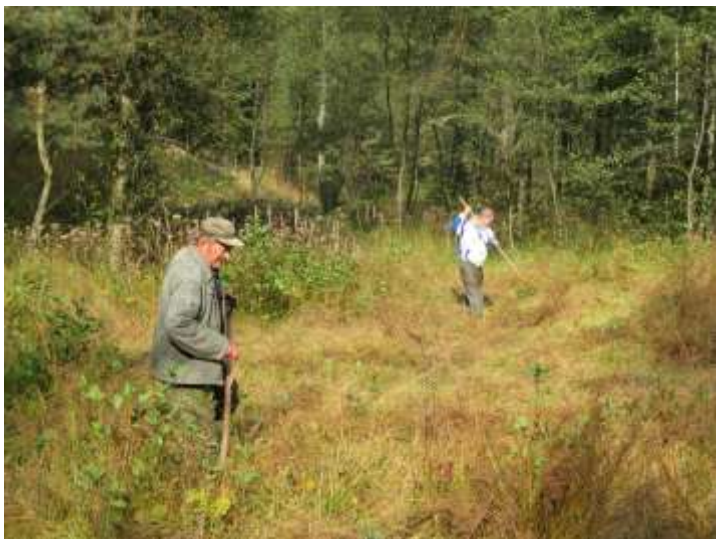
Sekání louky v NPP Rečkov

V porostu převažoval především rákos jehož následné hrabání a odvážení bylo obtížné. Údržba luk probíhá ve spolupráci se Správou CHKO Kokořínsko v rámci programu Péče o krajinu.