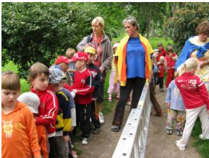
Kontrola hnízdění zpěvných ptáků s dětmi MŠ Štěpánka