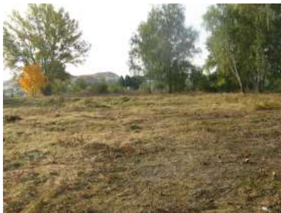
Lokalita po zásahu