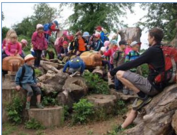
Předání cen a výlet v lokalitě Vinořský park-Satalická Bažantnice; Praha