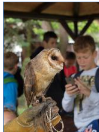
Děti v záchrané stanici pro zvířata, Pátek u Poděbrad