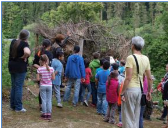
Exkurze v Bečovské botanické zahradě; Bečov nad Teplou